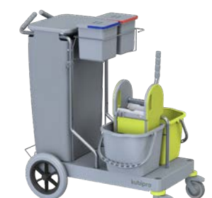
KUBI 6 PRO BIG-FOOT