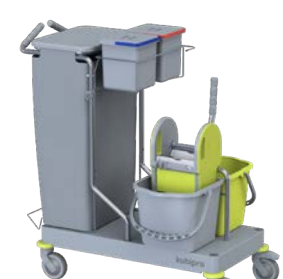
KUBI 6 PRO